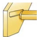
Steginfästning med tapp