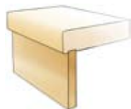
Sättsteg (vid tät trappa)